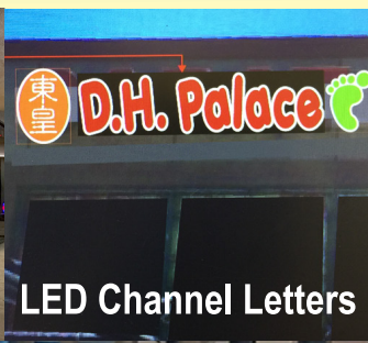
LED Channel Letters