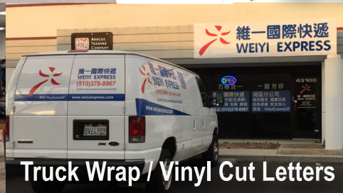
Truck Wrap / Vinyl Cut Letters